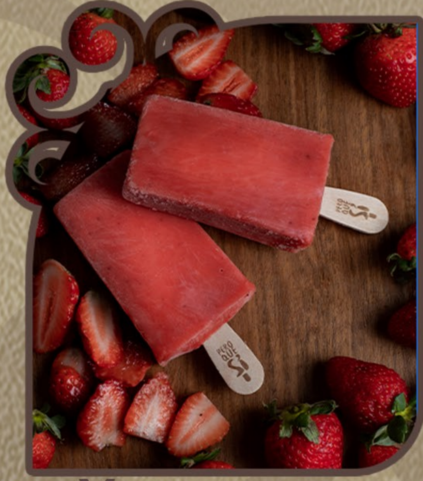
Morango com manjeriço