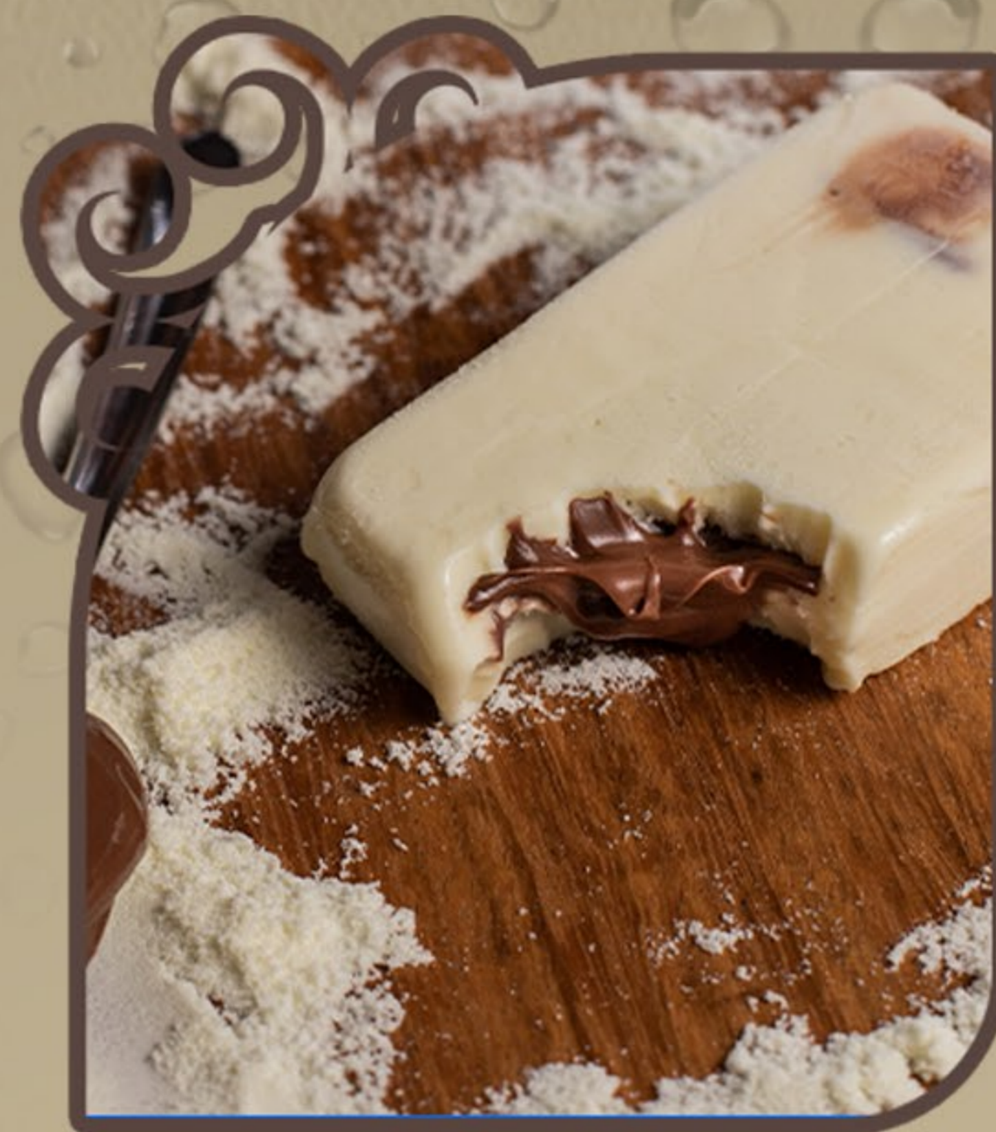
Ninho com nutella