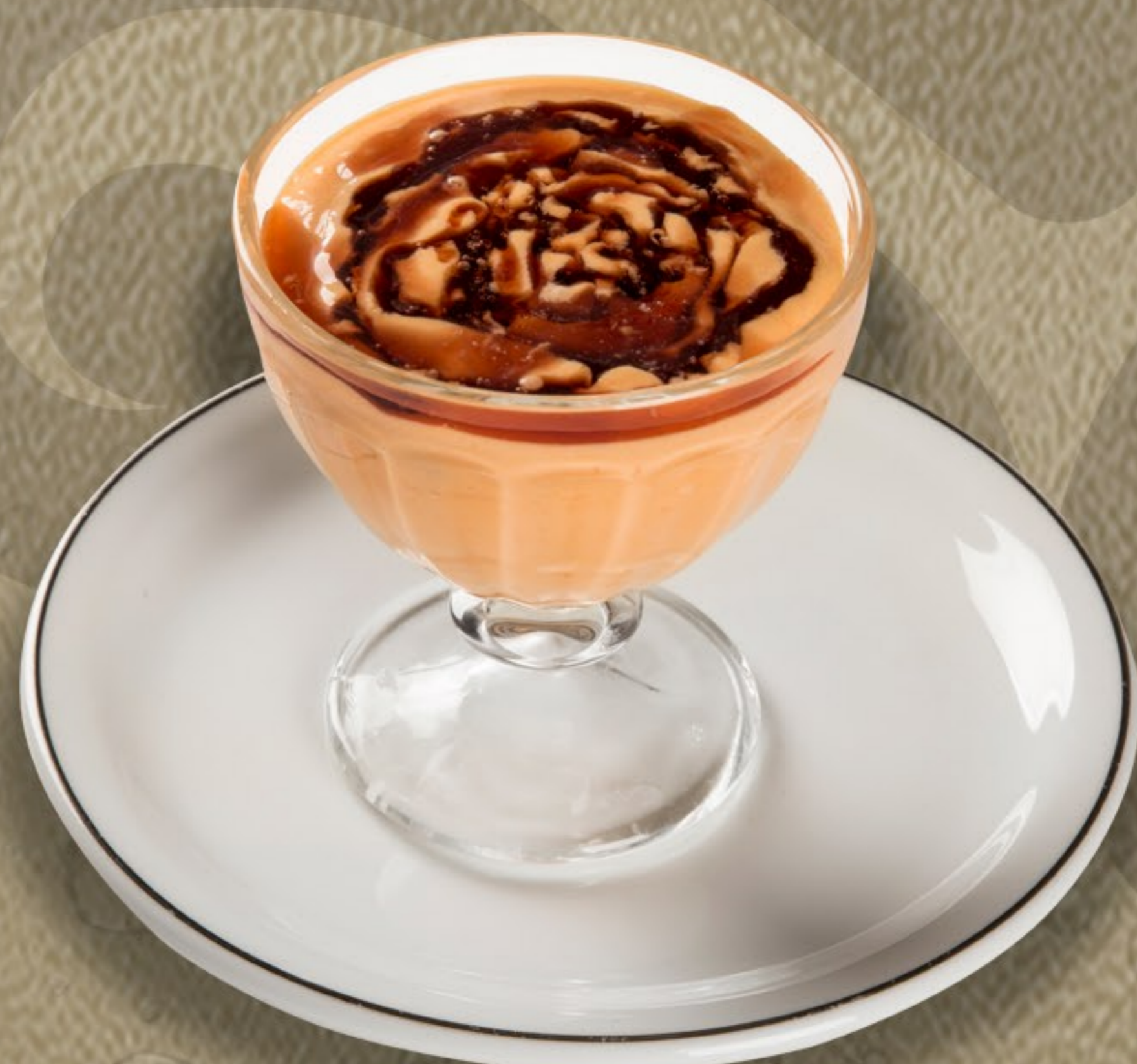
Creme de Papaya com sorvete e licor de Cassis R$ 22,50