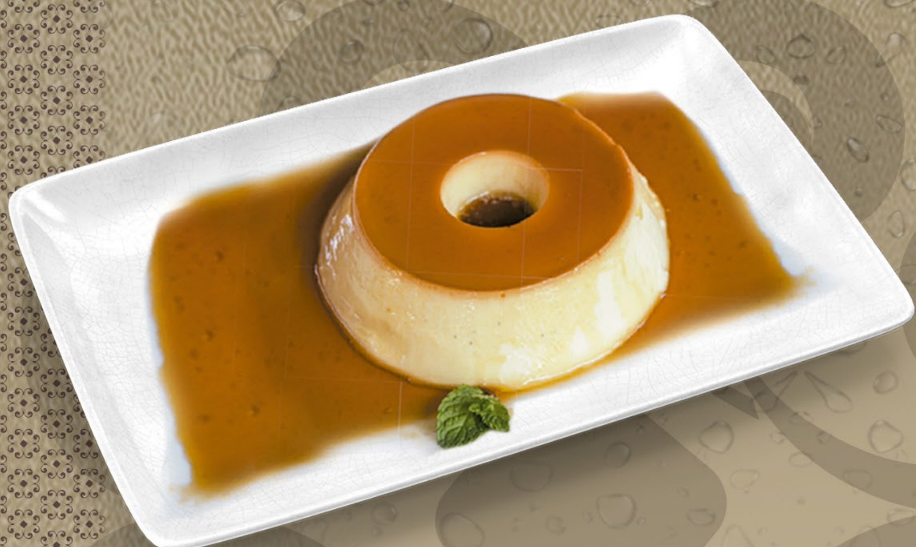
Pudim de leite condensado R$ 15,90