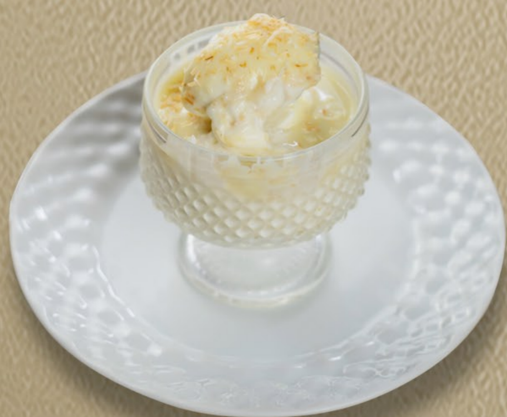
Mousse de Coco R$ 15,00