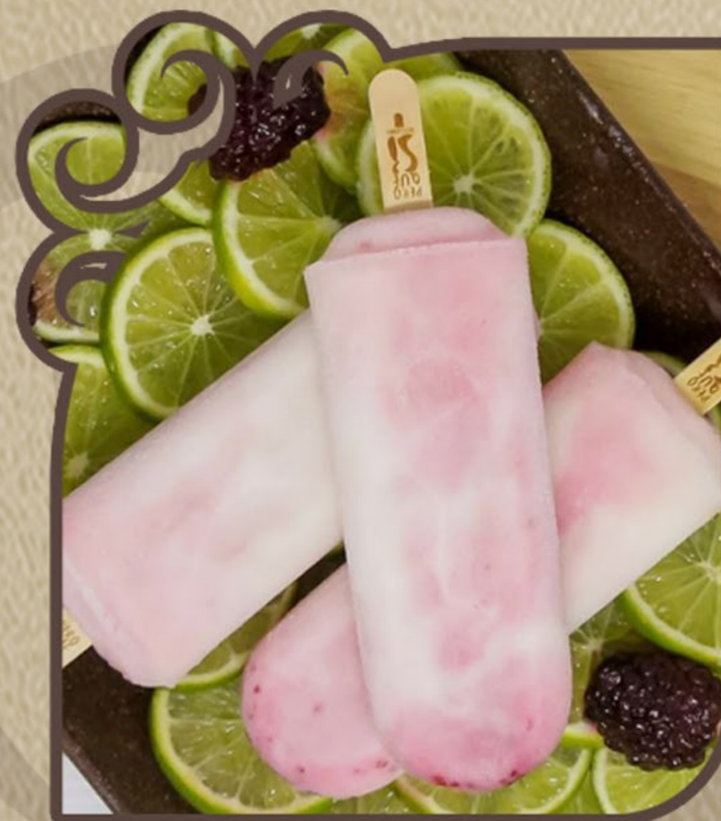
Limonada com amora