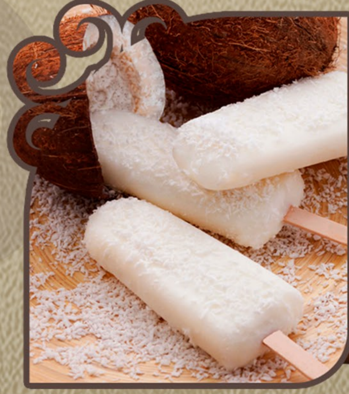
Coco zero açúcar

Base de leite de coco com pedaços da fruta