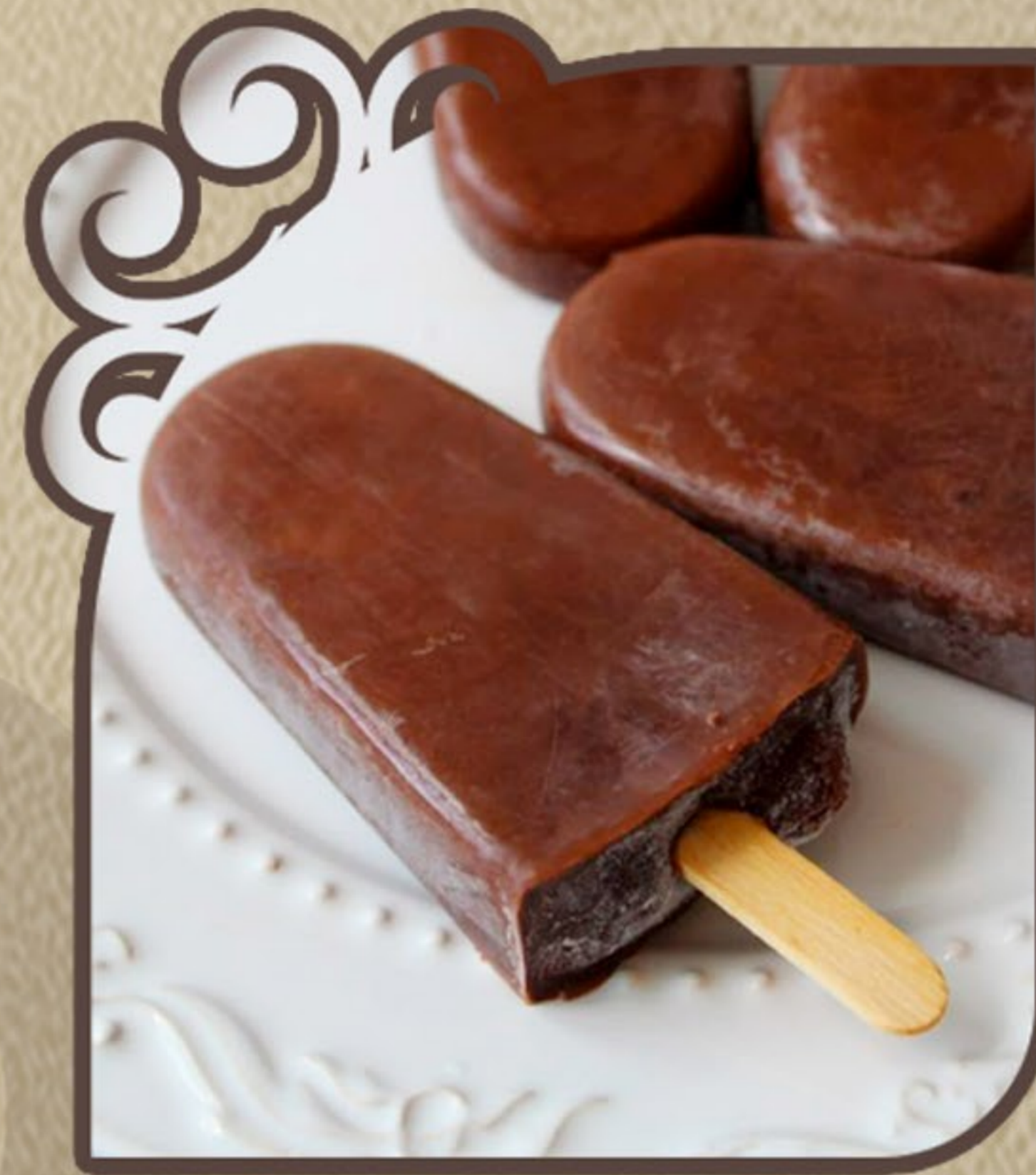
Cacau zero açúcar