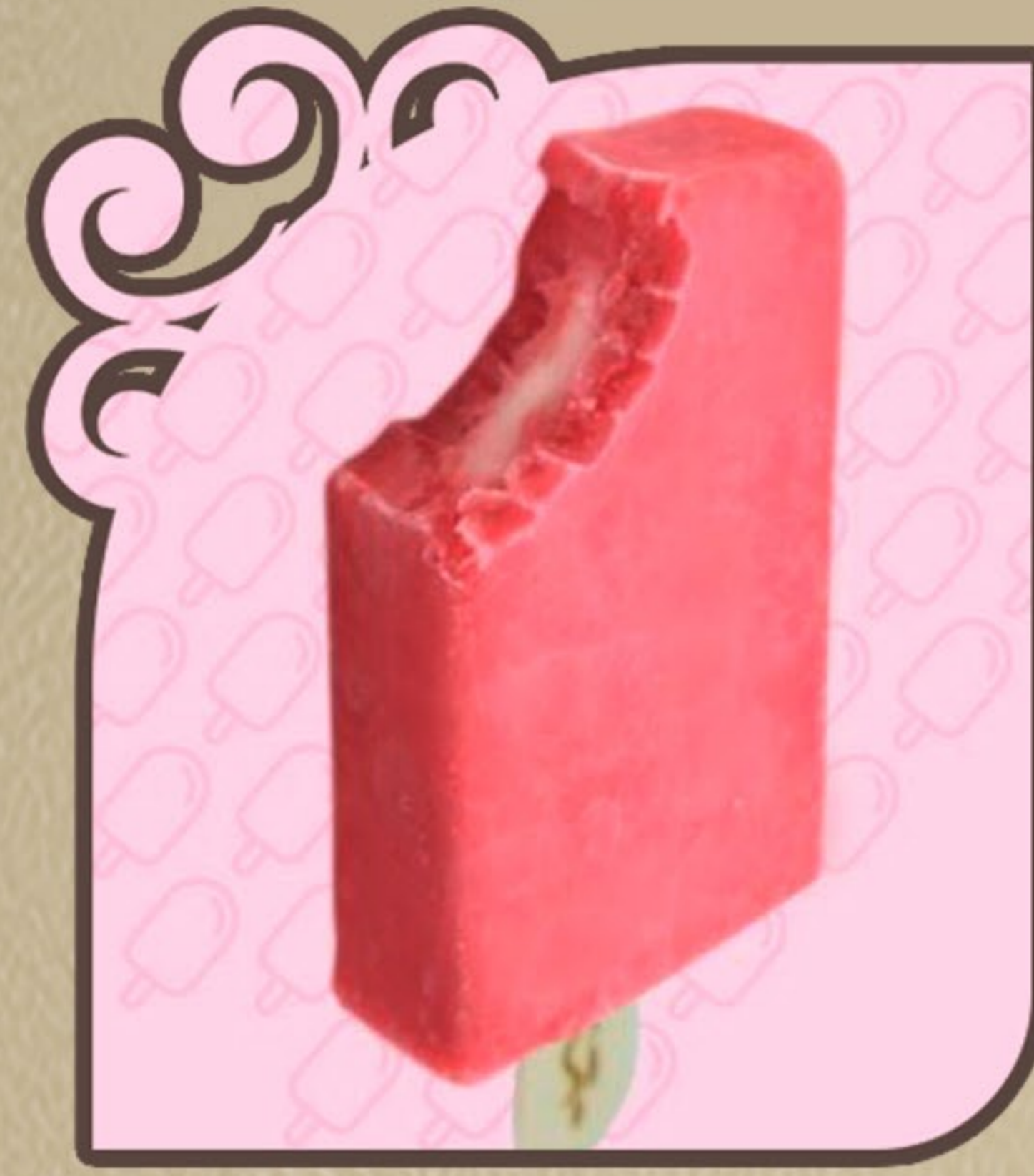
Morango com leite condensado

Feito por quem ama, para quem ama amendoim