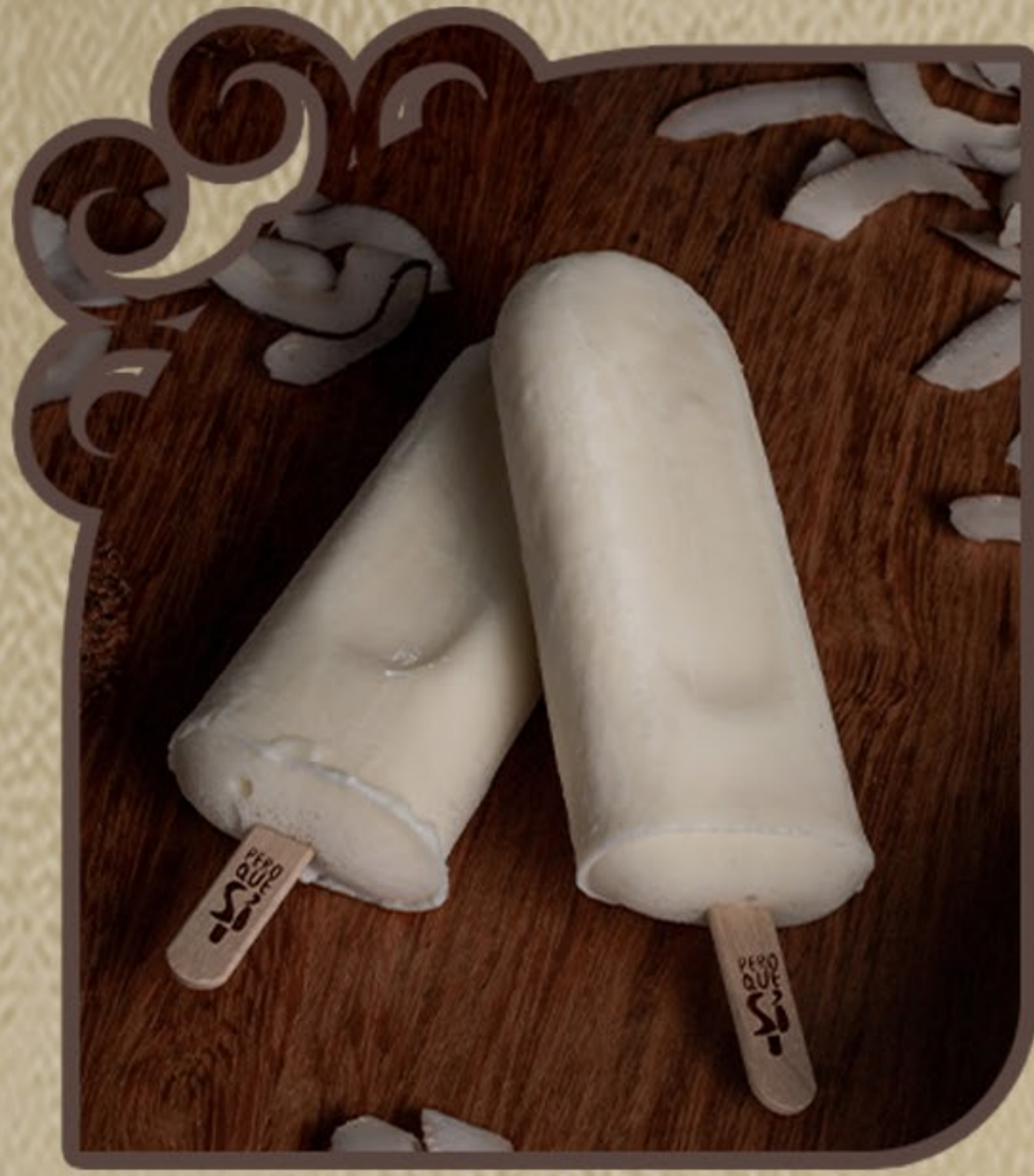
Maracujá com erva doce

Feito por quem ama, para quem ama amendoim